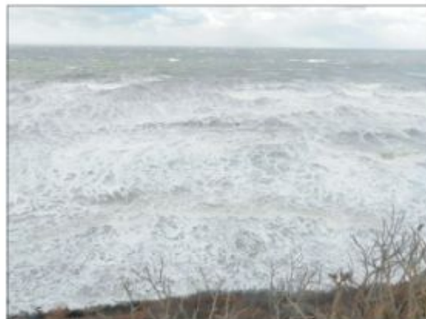
Fra Hyllingbjerg før og under stormen Bodil, 1. dec. og 6 dec. 2013, kl. 13.

kystbeskyttende virkning. Dette er ikke korrekt. Lad os se på resultater af forsøg med bølger, der forplanter sig hen over en bølgebryder.